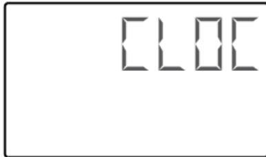
(Flash de transition d'1 sec)