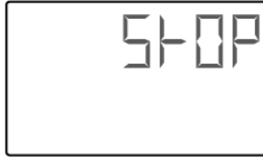
(Flash de transition d'1 sec)